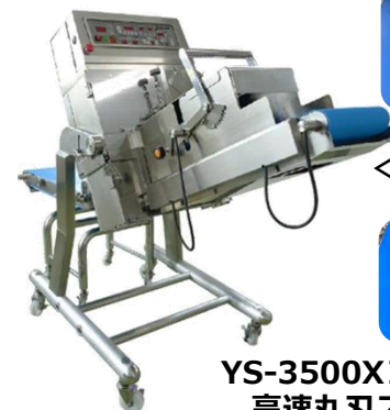
YS-3500XII型 高速丸刃スライサー (鱗列仕様)