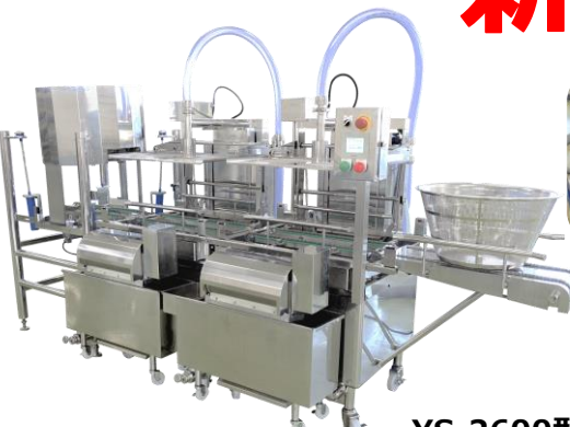
YS-2600型 ガルカゴ式洗淨機 (脱水機付き)