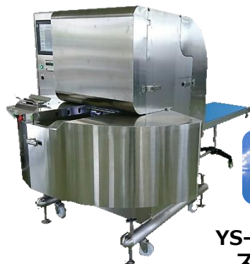
YS-3100XII型 スーパー魚やさん